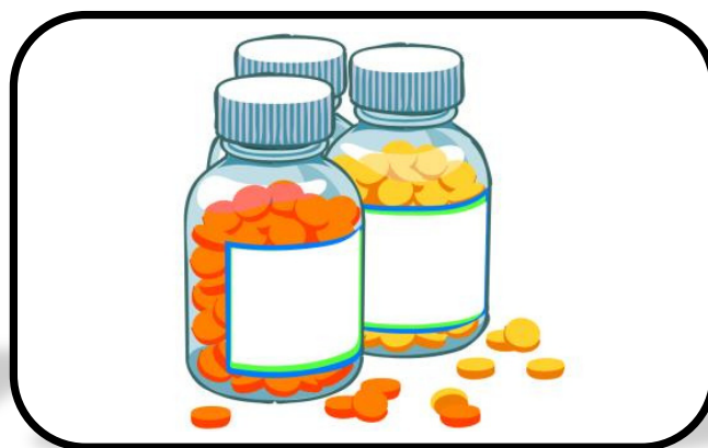
Valutazione del rischio Cardiovascolare

Domenica 24 Settembre dalle ore 9 alle ore 12